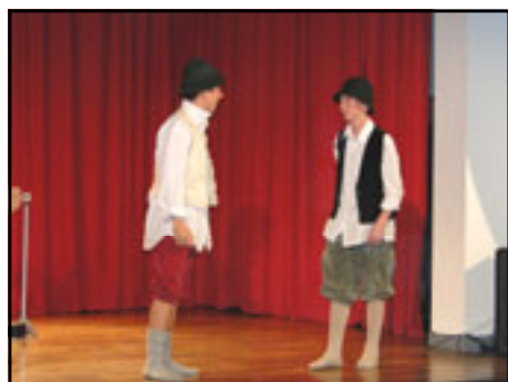
Les élèves de Quatrième et de BEPA 1 en représentation lors de l'Assemblée Générale, le 16 décembre 2010.

PORTES OUVERTES Le 18 mai 2011 de 13h30 à 18h30